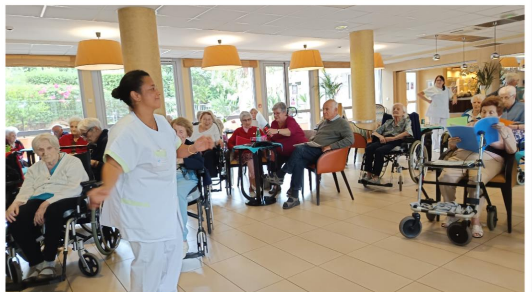
Dimanche après-midi en musique et chansons