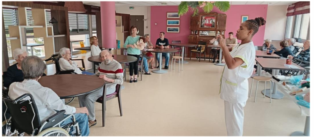
Loto à Porquerolles