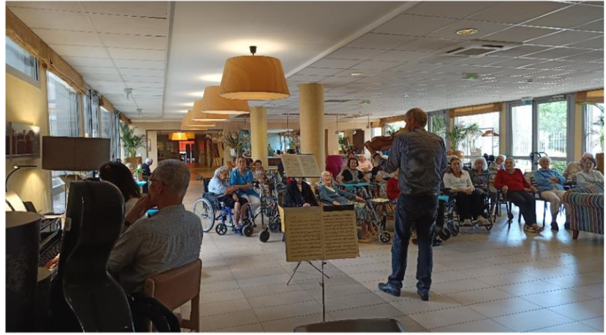
Récital violon, violoncelle et piano

Ces activités favorisent les échanges entre les résidents, le personnel, les intervenants et valorisent l'image et l'estime de soi.