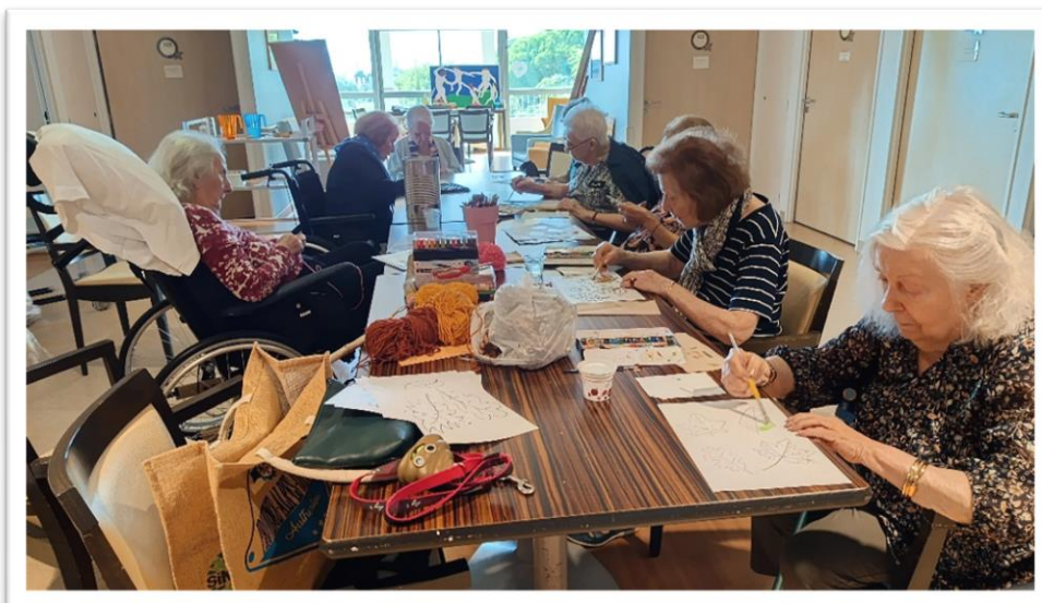
Atelier créatif au Lérins