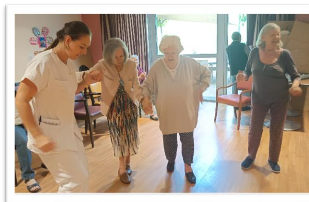
Expression corporelle à Porquerolles